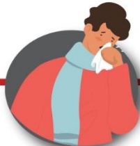
Después de toser o estornudar