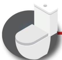
Después de ir al baño