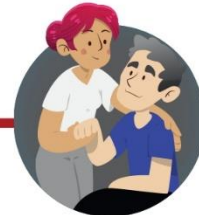
Cuando cuides enfermos