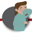
Cubre boca y nariz al toser o estornudar usando la parte interior del codo o con un pañuelo desechable